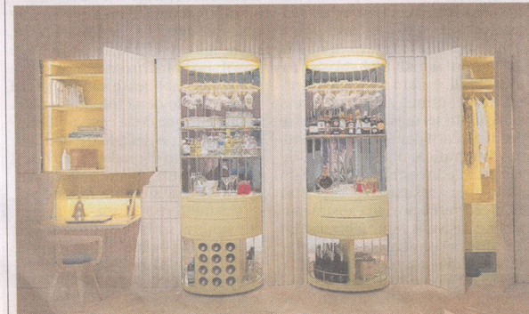
Effetto sorpresa Postazione di lavoro, angolo bar, armadio: è Surprise, la boiserie trasformista di Lorenza Bozzoli per Fratelli Boffi