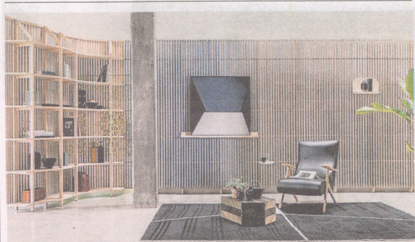
In continuo Un pannello continuo da personalizzare con porta tv, mensole e portaoggetti: è Marechiaro di Philippe Nigro per A&B living