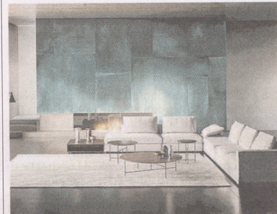
Valore aggiunto Boiserie di De Castelli, un rivestimento decorativo in rame per impreziosire pareti e superfici